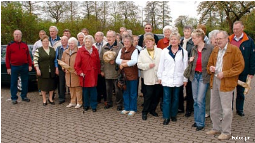
Vier abwechslungsreiche Tage verlebten die Besucher aus Zempin und ihre KleinNordender Gastgeber.